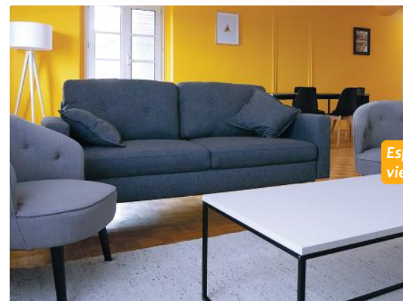
Espace de vie partagé.