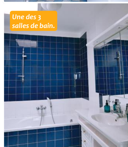
Une des 3 salles de bain.