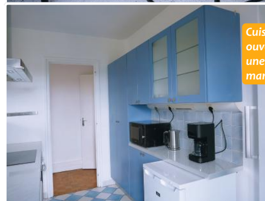
Cuisine ouverte sur une salle à manger.