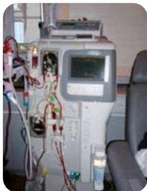
Modèle « Integra » du laboratoire Hospital