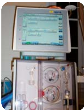
Modèle « 5008 » du laboratoire Fresenius